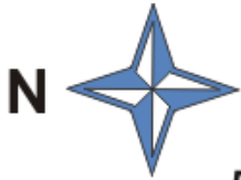
СХЕМА ЗАСОБІВ БЕЗПЕКИ НА ТРАСІ ДЛЯ КОЛЬЦЕВИХ ГОНОК АВТОДРОМ "ЧАЙКА" ЦК ТСО УКРАЇНИ